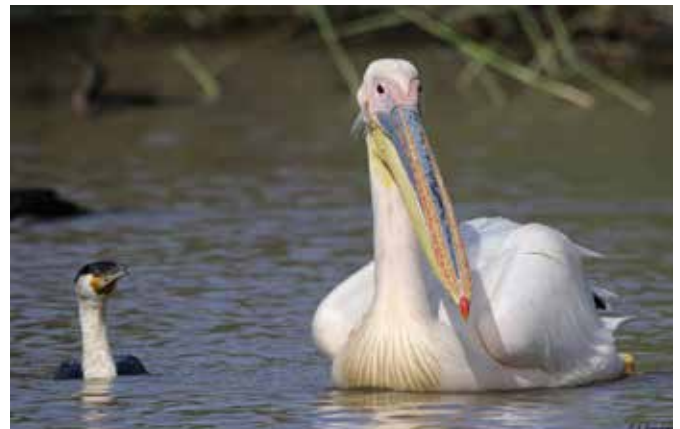
Rosapelikan im Diawling-Nationalpark

Verein Sächsischer Ornithologen e.V. (VSO) – Regionalgruppe Chemnitz