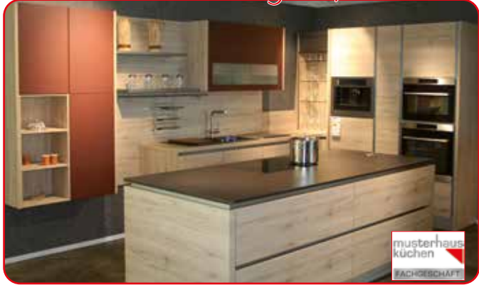
Limbacher Möbelhaus GmbH | Wolkenburger Straße 23 | 09212 Limbach-Oberfrohna Telefon: 037 22 - 922 48 | www.limbacher.kuechen.de