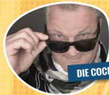
DIE COCKER SHOW