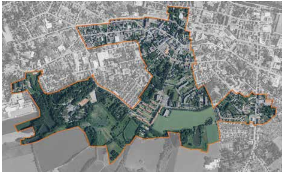
Abgrenzung des Untersuchungsgebietes mit Innenstadt – Wohngebiet am Wasserturm – Tierpark und Teichlandschaft

per E-Mail an j.kirsten@limbach-oberfrohna.de bis zum 31.07.2022 einreichen.