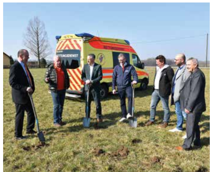
Beim ersten Spatenstich für die neue Rettungswache an der Hohensteiner Straße.

Die Inbetriebnahme des Stützpunktes ist für Ende 2023 geplant.