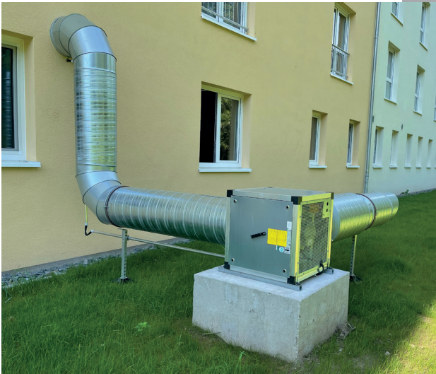
Lüftungsanlage mit 3000 m 3 /h