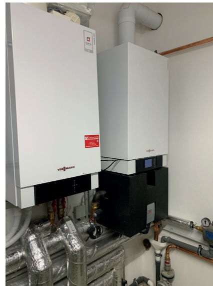
Wärmepumpe Inneneinheit kombiniert mit einem Gasbrenn- wertgerät