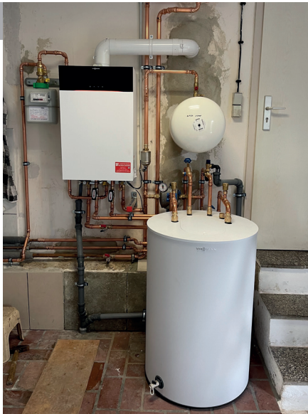
Gasbrennwert- wandgerät 20 kW mit Speicher