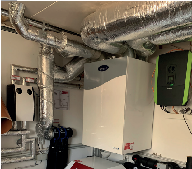
Zentrales Lüftungsgerät in einem EFH