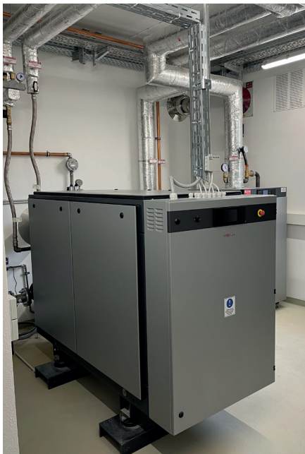
BHKW mit Gasbrennwert- gerät 200 kW