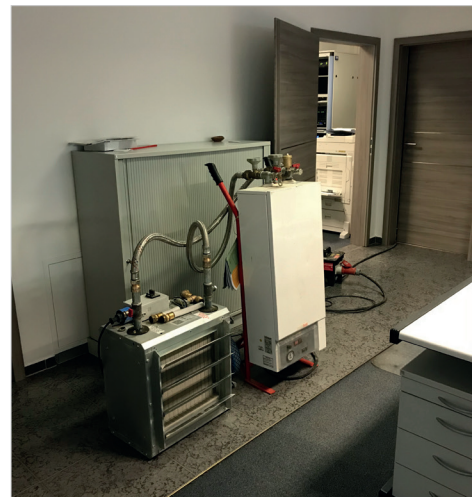
Kleine mobile Heizung für Notfälle