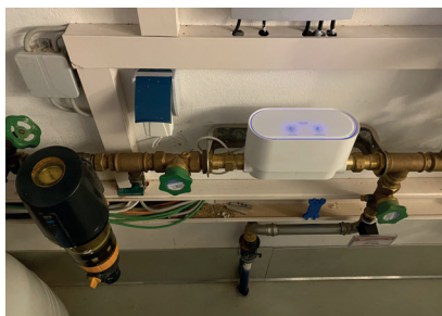
Trinkwasserfilter für sauberes Wasser und Grohe Sense Guard, welche Leckagen erkennt und somit Wasserschäden vorbeugt.