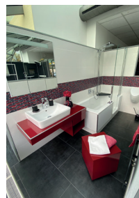
Wir haben eine eigene Ausstellung mit bis zu neun Kojen in denen wir unsere Kunden direkt beraten können.