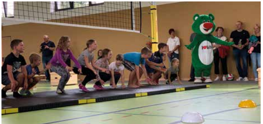
Turnerinnen der GS „Thomas-Münzer“ zeigten ein selbst einstudiertes Programm und anschließend waren alle Kinder und LIMBO zum „Tanzalarm“ (Foto oben) eingeladen.