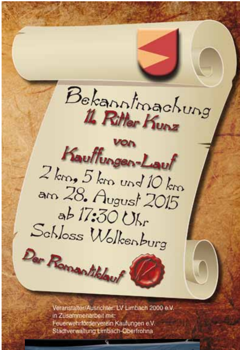
Veranstalter/Ausrichter: LV Limbach 2000 e.V. in Zusammenarbeit mit: Feuerwehrförderverein Kaufungen e.V. Stadtverwaltung Limbach-Oberfrohna

Zum 11. Mal ruft Kunz von Kauffungen sein Gefolge zum Romantikauf, bei dem viele Teilnehmer im Kostüm erscheinen. Zu den Besonderheiten des Laufs gehört, dass es Fettbommen und Wein an den Verpflegungsstellen gibt. Zudem gibt es nicht nur Urkunden und Medaillen für die Gewinner, sondern auch „kleine“ Preise: Der Sieger über 10 Kilometer darf sich über eine Weihnachtsgans freuen; der Sieger über 5 Kilometer über einen Hasen. Der Gewinner des 2-Kilometer-Laufs erhält ein Meerschweinchen.