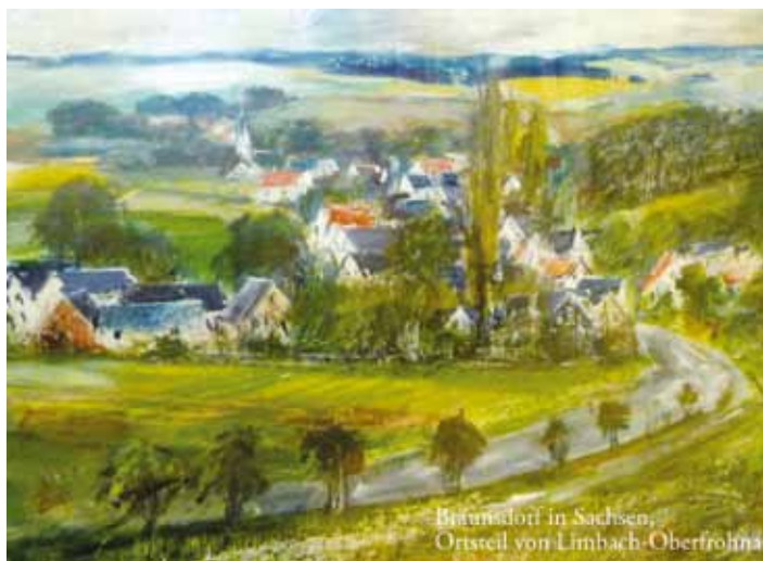
Bräunsdorf in Sachsen, Ortsteil von Limbach-Oberfrohna

Seit nunmehr 25 Jahren bestehen fruchtbare Kontakte zwischen Leinach und Bräunsdorf im mittelsächsischen Landkreis Zwickau. Es begann 1990 mit dem Kennenlernen der beiden Bürgermeister und parallel dazu auch von Kameraden der Unterleinacher Feuerwehr. Teilnahmen von Bräunsdorfern am Neujahrsempfang unseres Bürgermeisters und von Besuche bei Leinacher Vereinen und speziell zur Maibaumaufstellung und dem Kirschblütenfest des Obst- und Gartenbauvereins sind zur Tradition geworden. Die Beziehungen weiteten sich mittlerweile auch auf die Industriestadt Limbach-Oberfrohna aus, deren Ortsteil Bräunsdorf seit 1998 ist.